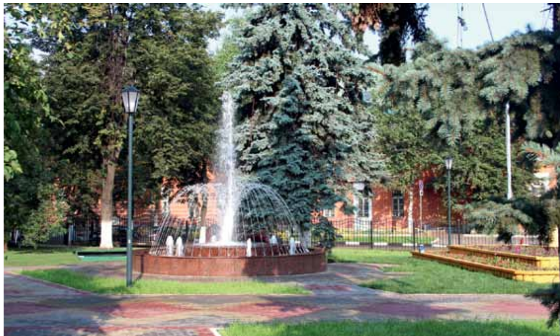
Парк Казачьей Славы в Лефортово