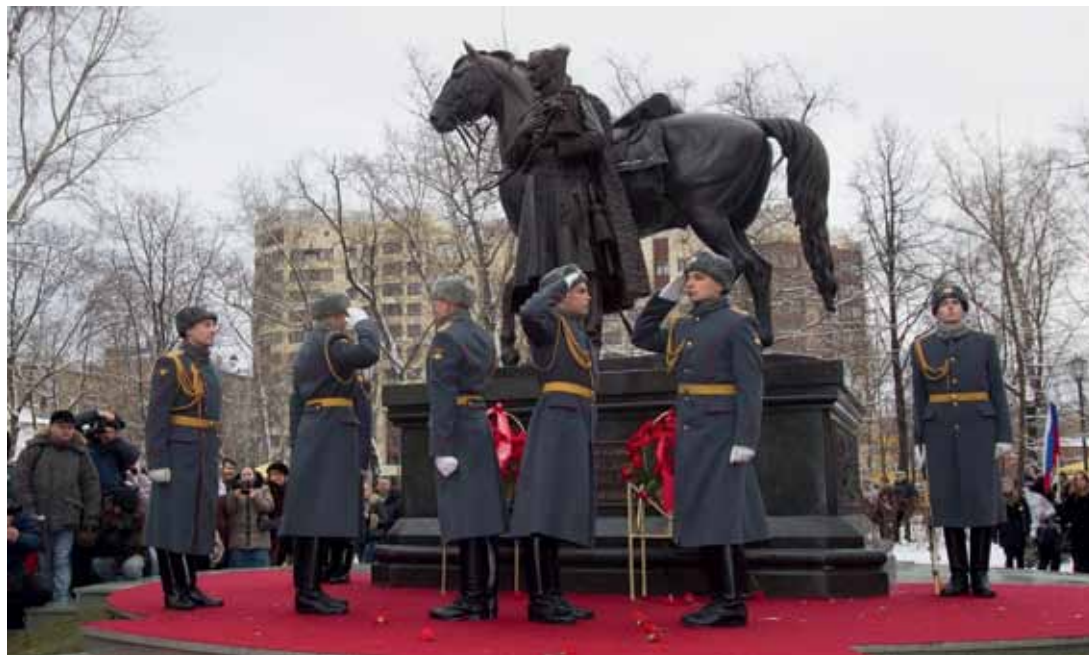
Почетный караул на памятнике атаману М. Платову, 7.12.2013 г.