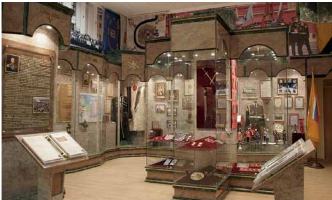
Музей «История казачества» в Московском казачьем кадетском корпусе