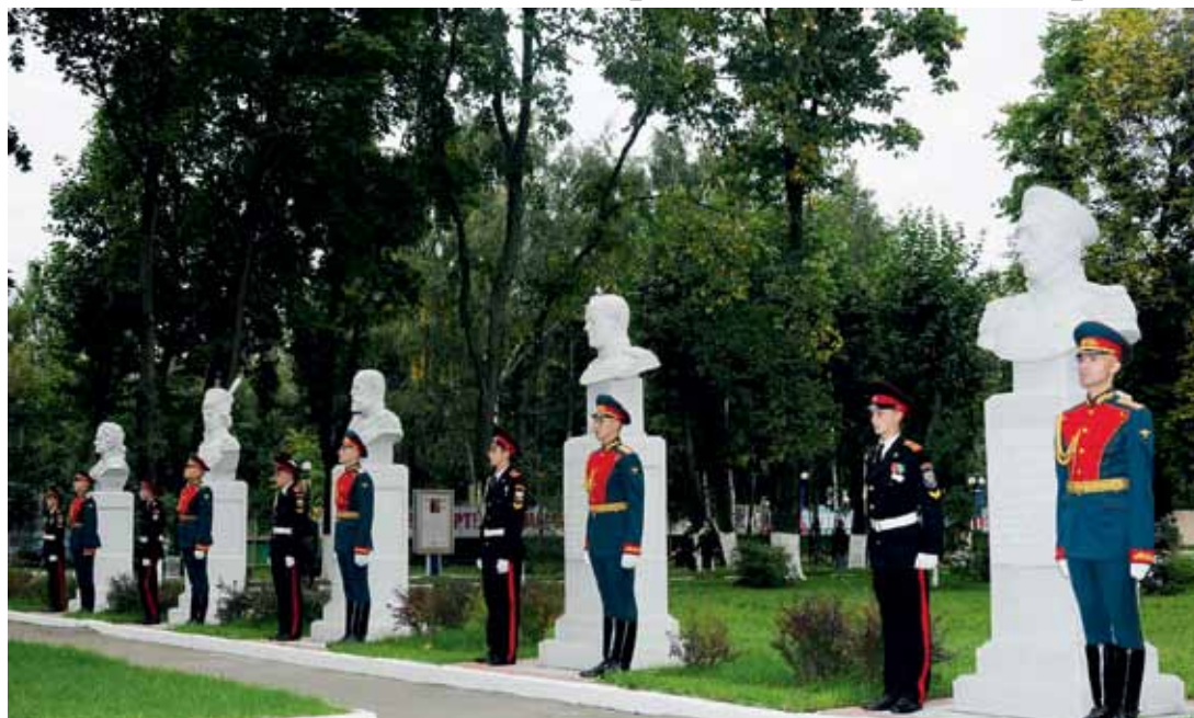
Аллея Славы на территории Московского казачьего кадетского корпуса им. М. А. Шолохова