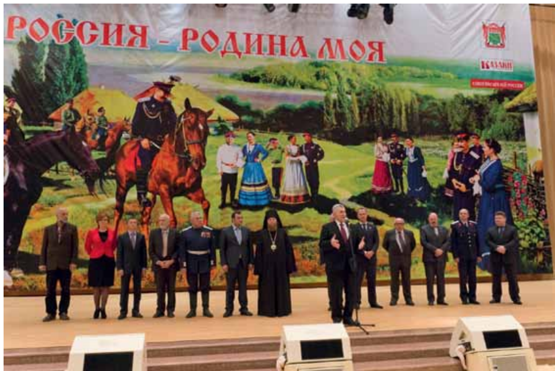
Финал конкурса «Славься, казачество!» в зале Церковных Соборов Храма Христа Спасителя