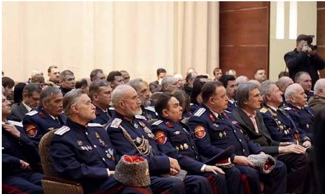
Заседание Совета по делам казачества в ЮВАО