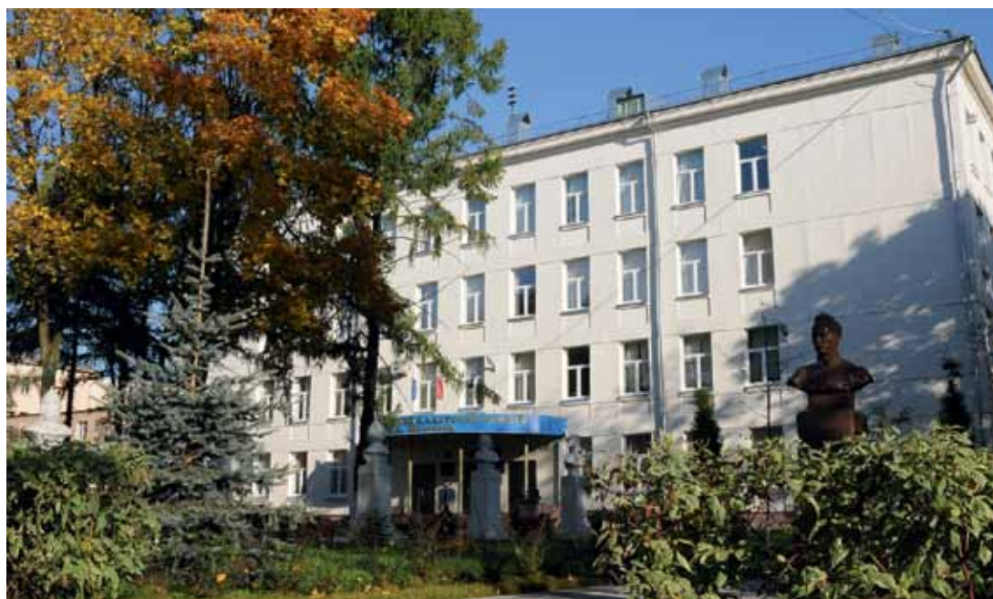
Памятник М. А. Шолохову на территории кадетского корпуса