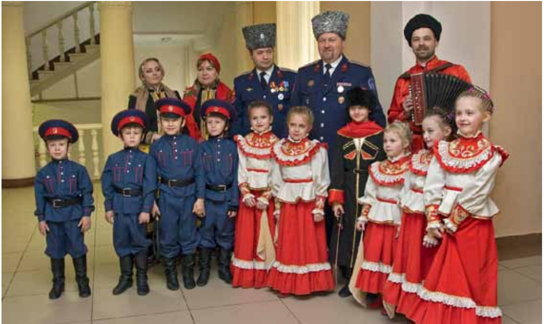
Участники и организаторы фестиваля «Лейся, казачья песня!»