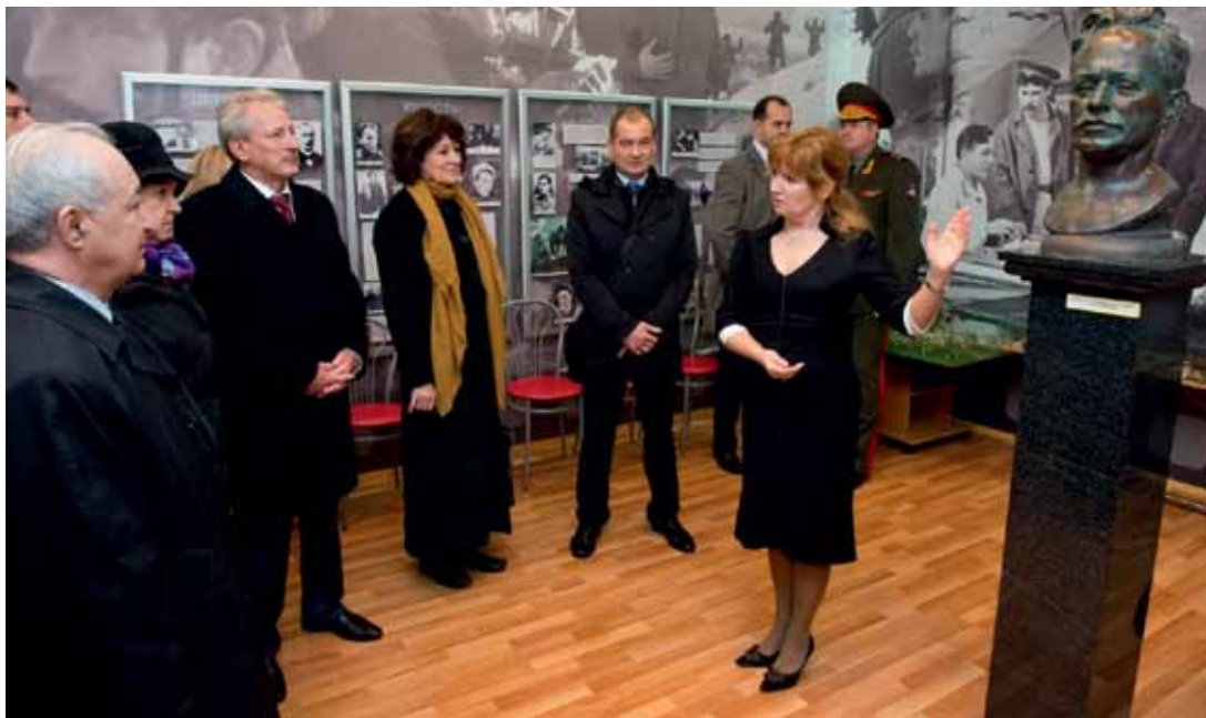
Мемориальная комната М. А. Шолохова в казачьем кадетском корпусе им.М.А.Шолохова