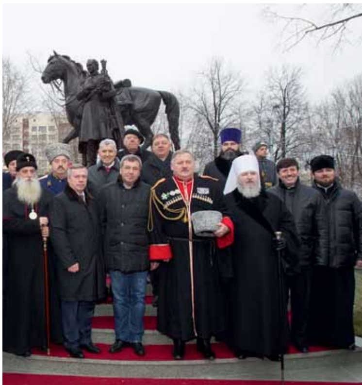
Открытие памятника атаману Матвею Платову в парке «Казачья Слава»