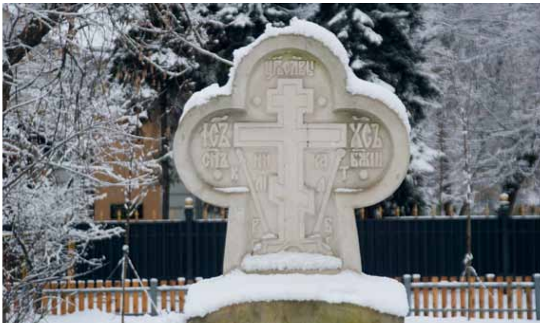
Поклонный крест в память о герое Отечественной войны 1812 г. атамане Донского казачьего войска М. И. Платове