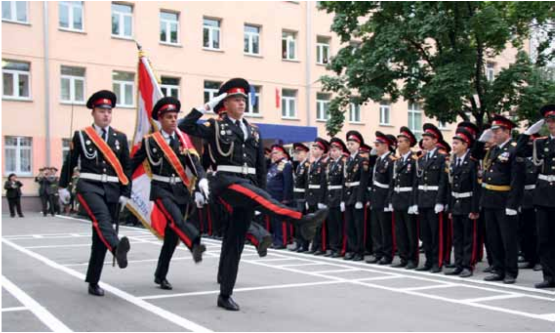
Московский казачий кадетский корпус им.М.А. Шолохова