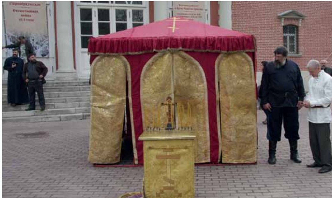
Походная церковь атамана Платова в Рогожской слободе