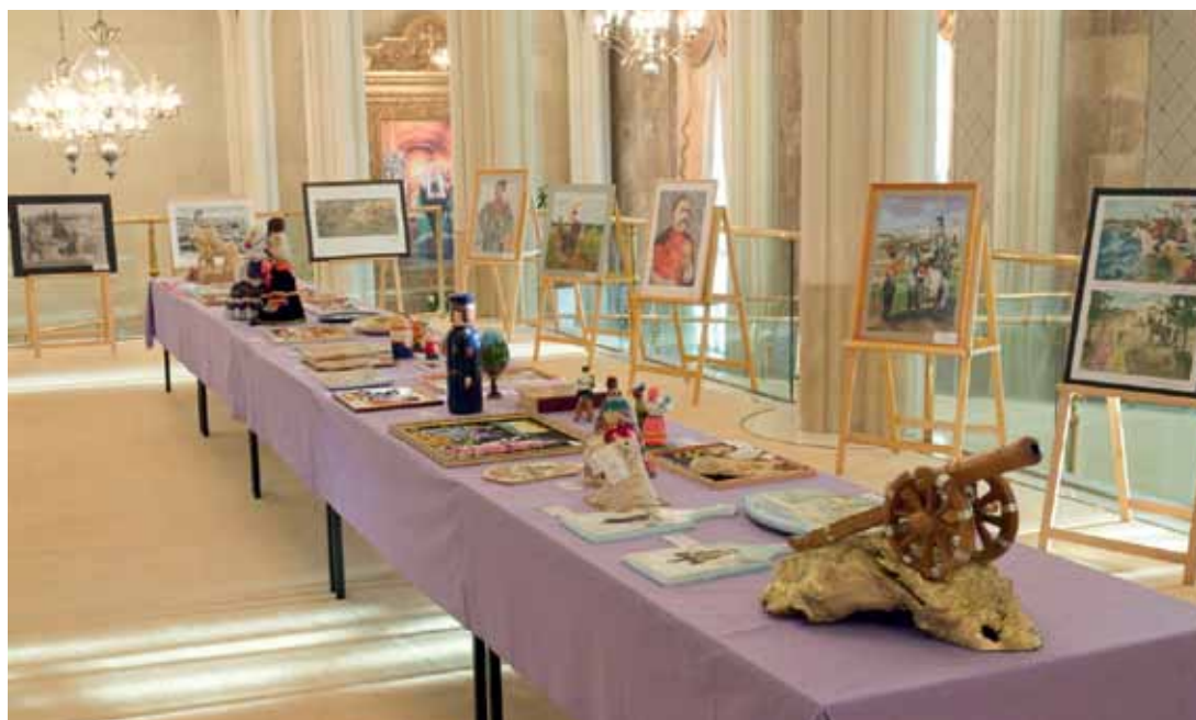
Выставка участников конкурса «Славься, казачество!» в зале Церковных Соборов Храма Христа Спасителя